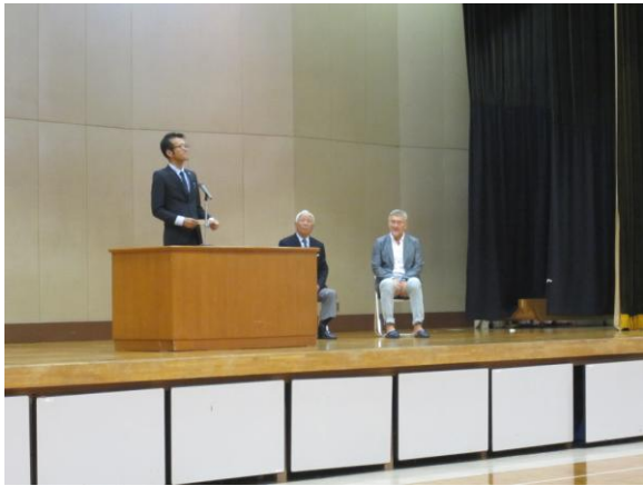
(2学期の始業式で紹介した写真です)

秋季関東地区高等学校野球大会群馬県予選から、野球部が新体制でスタートしました。新たに指導にあたる監督、コーチを紹介します。